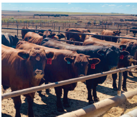
Novillos cruzados de Beefmasters que fueron parte del estudio en el Noble Research Institute de Oklahoma.