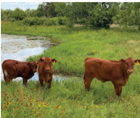
Terneros Beefmasters L Bar, es el tipo de animal que necesitamos en nuestros pastos.

haya forjado como una de las mejores genéticas a nivel mundial. No por gusto el profesor y catedrático sudáfricano Bonsma, al conocer el rebaño fundacional Beefmasters en 1937 lo describió como el rebaño ganadero más eficiente del mundo y bajo la misma Filosofía de Tom Lasater comenzó a trabajar en la creación del Bonsmara. Dr. Bonsma continuó con una relación muy cercana a la familia Lasater a lo largo de su vida, participando juntos en varias conferencias de campo en diferentes lugares del mundo. Otro gran visionario en el manejo de pasturas, Allan Savory de Zimbabwe, al llegar a Estados Unidos conoció igualmente lo que la familia Lasater promulgaba desde hacía muchos años atrás y ver que la regeneración de pasturas y el cuidado de los suelos era práctica común para ellos. La familia Lasater fue quien impulsó a los ganaderos en Estados Unidos a este tipo de manejo y apoyó a Allan Savory