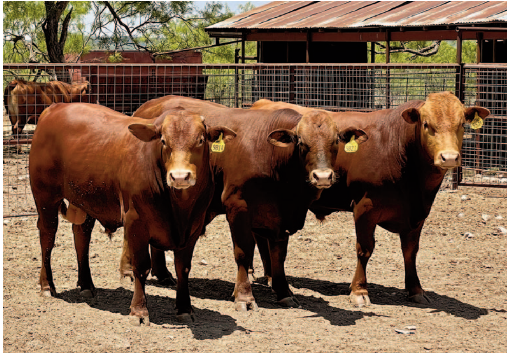
Excelentes toros L Bar desarrollados a pasto de solo 20 meses de edad, listos para comenzar a trabajar.